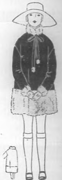
Abriquito de terciopelo de color rojo, adornado de piel.

Los orzuelos, se curan de varias maneras y una muy sencilla es lavarlos con agua boricada, con lo que ellos solos se abren una vez más. Una vez conseguido esto, se esprime bien y se sigue lavando con la misma agua y algodón nuevo cada vez que lo haga, de manera de que se reproduzcan. Si salen varios, suelen tirar las pestañas. Para evitar el jabón "Perisul" con agua templada. Para evitar la caída de las pestañas, aplíquese con un pincel la siguiente preparación: Vaselina, cinco gramos; aceite ricino, dos gramos; acetilglicol, cinco gramos; esencia de lavanda, cuatro gotas.