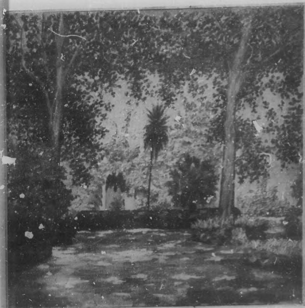
JARDIN DE MALLORCA Oleo de Manuel Fernández Peña.