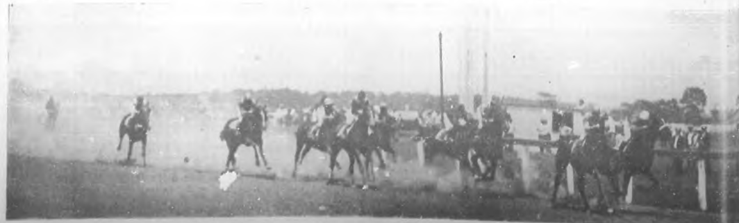
Un "vacío" de buenos corredores llegando a la meta en un reñido final.