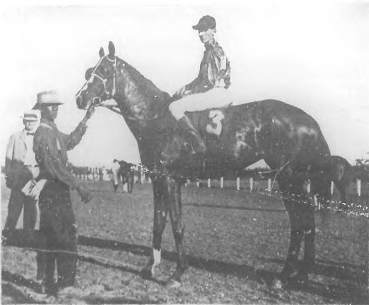
"Nimrod", caballo que está clasificado como la estrella del "meeting" y que de siete salidas sólo ha dejado de ganar una.