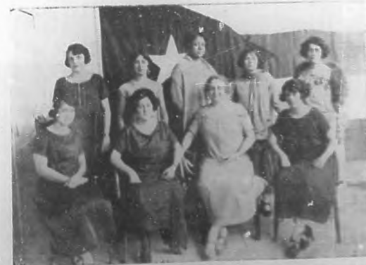
La directora y parte del profesorado de la Escuela 66. La actuación de estas maestras ejemplares por su cultura y por su laboriosidad, es una garantía de triunfo para la Escuela Cubana.

El sábado 24 de enero actual dará principio en la Escuela número 16 de este Distrito, el Cursillo de perfeccionamiento de lectura, cuidadosamente organizado. Promete muchas cosas buenas