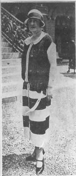
Modelo de georget, azul oscuro y blanco, todo plisado. Adornado con una hilera de pequeños botones de seda en azul.

La Simpatía, es cualidad modesta, pero eficazísima para hacerse amar. Tampoco ésta tiene origen en la belleza. Diría también que raramente las mujeres bellísimas la poseen, porque la Naturaleza ha reservado la simpatía como compensación a las que ha favorecido menos. ¡Cuántas veces hemos oído o pensado: "Fulana es bella, pero no es simpática". Y viceversa: "No es bella, pero es muy simpática".