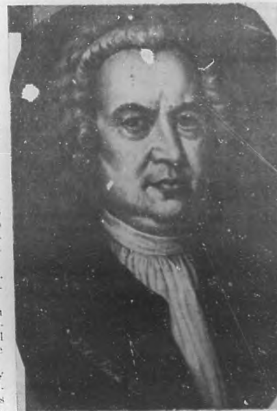
JUAN SEBASTIAN BACH Insigne compositor que fué y seguirá siendo el más sabio de los músicos.