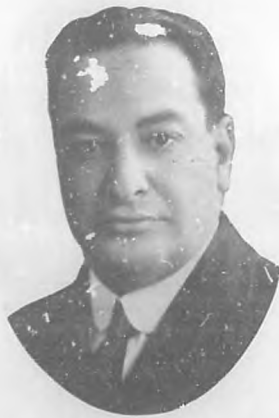
JOSÉ MARIA DE LA CUESTA Popular y benemérito Alcalde de nuestra Ciudad.