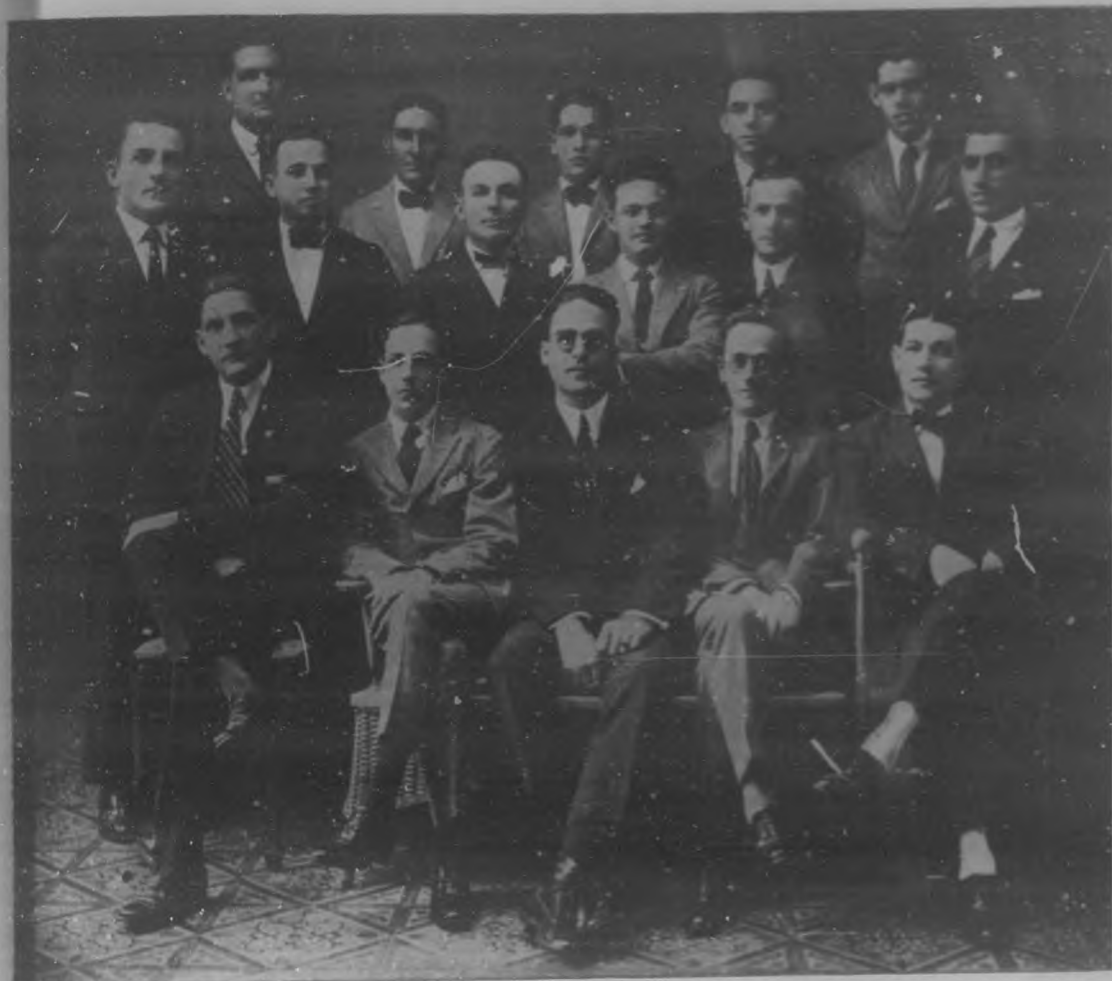
Prestigiosas personalidades que forman la sociedad "El Liceo", de Morón.