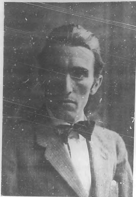
MANUEL FERNÁNDEZ PEÑA Joven e ilustre pintor español, huésped actualmente de nuestra capital, que nos ofrecerá muy en breve una exposición de sus obras en los salones del "Diario de la Marina".