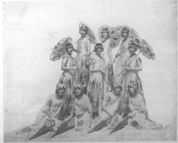
Uno de los números más sugestivos y de mayor éxito de la revista "Bon Bon", representada últimamente en el "Nacional".

De Amadeo Vives puede decirse que es actualmente el primero de los compositores españoles. Ni la alta fama de Pablo Luna, ni la justísima reputación del maestro Serrano pueden compar-